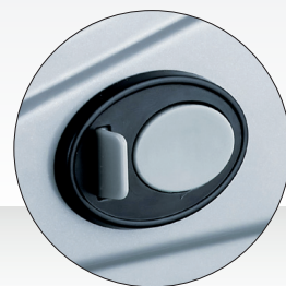
SCHALTER MIT SICHERHEITSVERRIEGELUNG