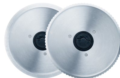
INKL. 2 MESSER (GLATT UND GEZAHNT)